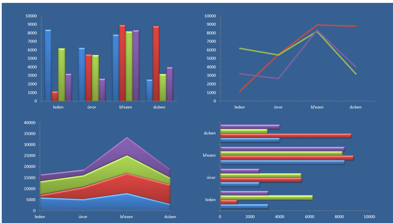
Excel Board - po spuštění (skutečný full screen)