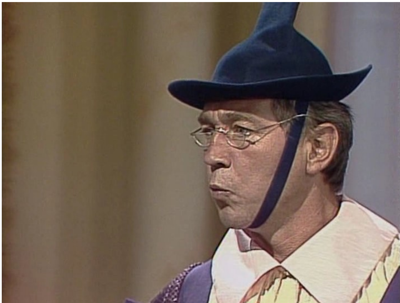
O princezně, která ráčkovala