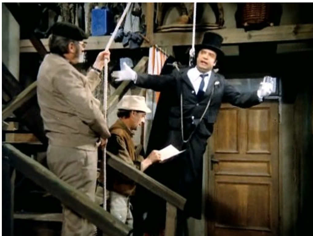
A takhle se to dělá...