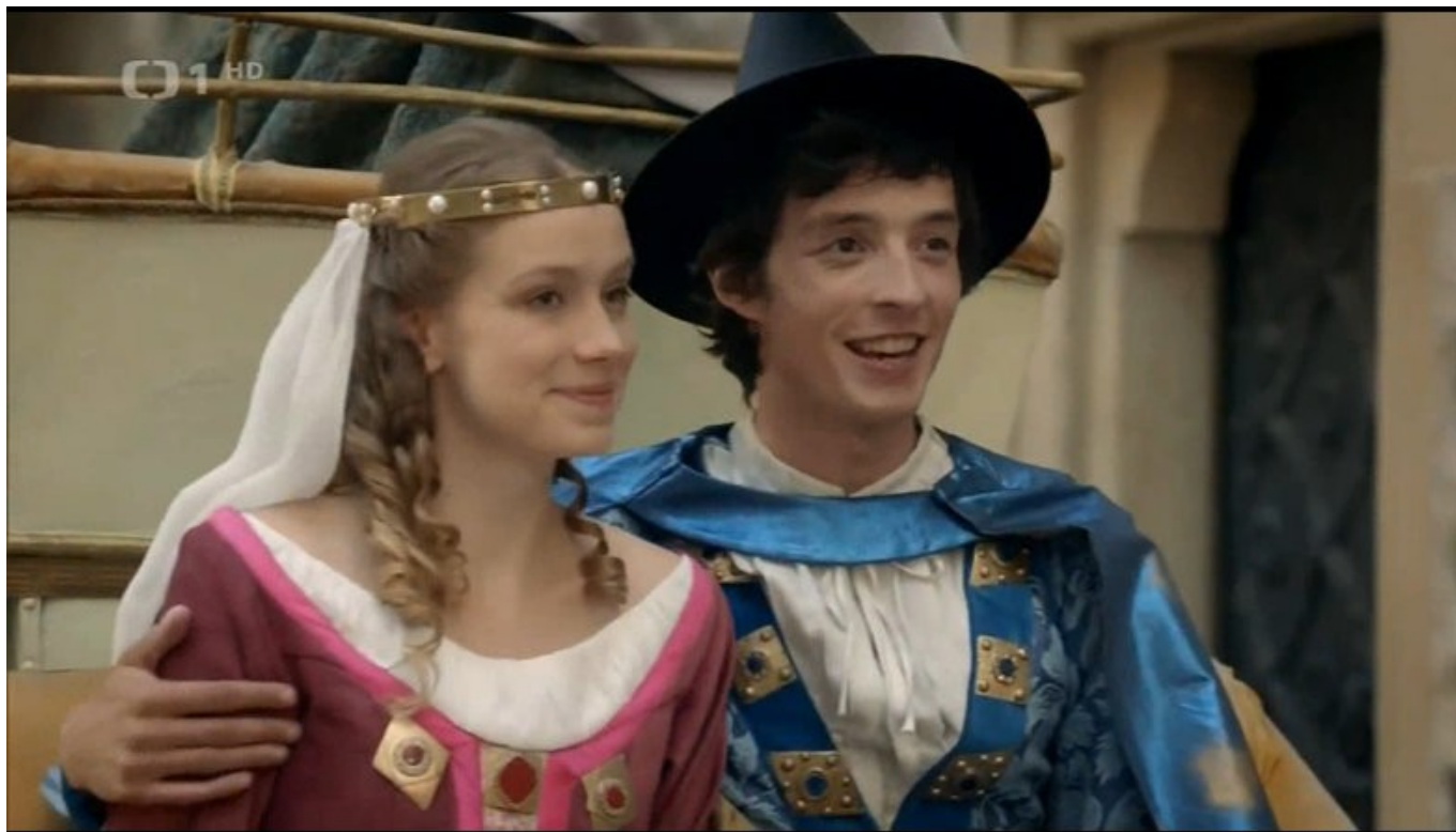
Kouzelník Žito (a nebo jsme v jiné pohádce?)

jak budou sloužit, žerou. Chvíli se Neklanovi směje do ksichtu, chvíli se před ním doslova klepe.