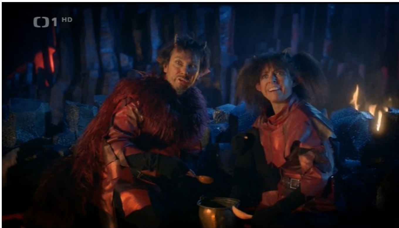
Čert a čertice