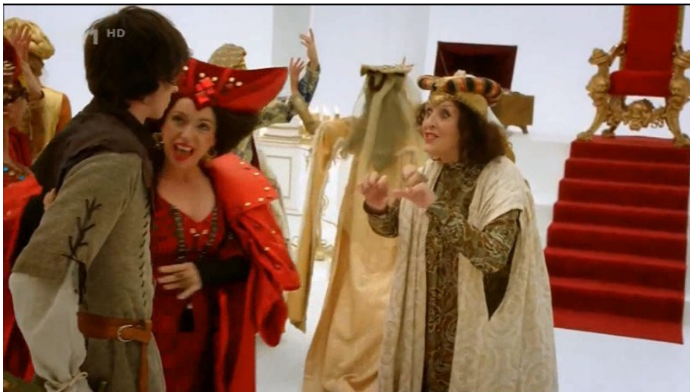
Česká zbohatlická smetánka