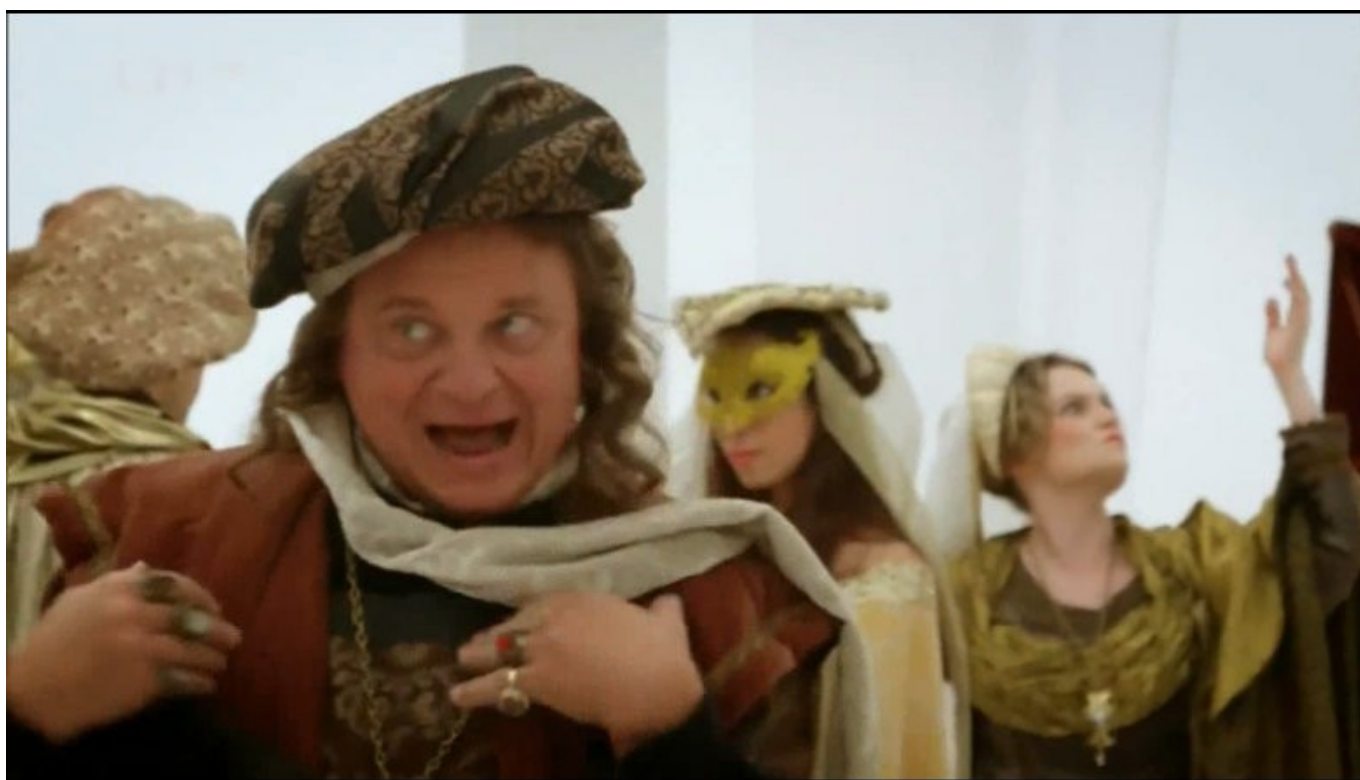
No jo, Pražský výběr :-D