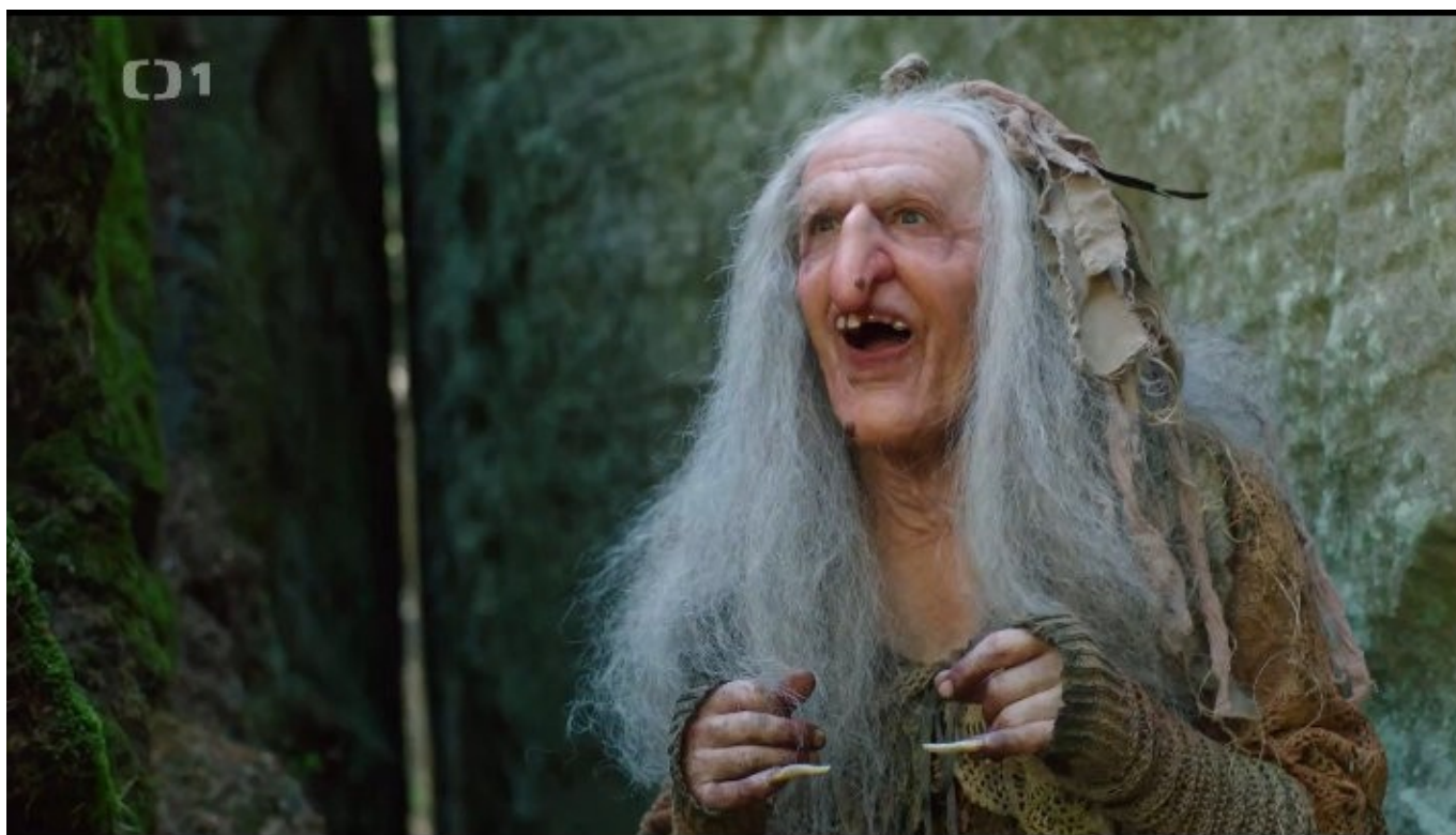
Perníková bába (dědek)