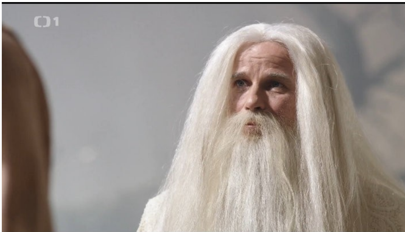
Prokletý král Svarog