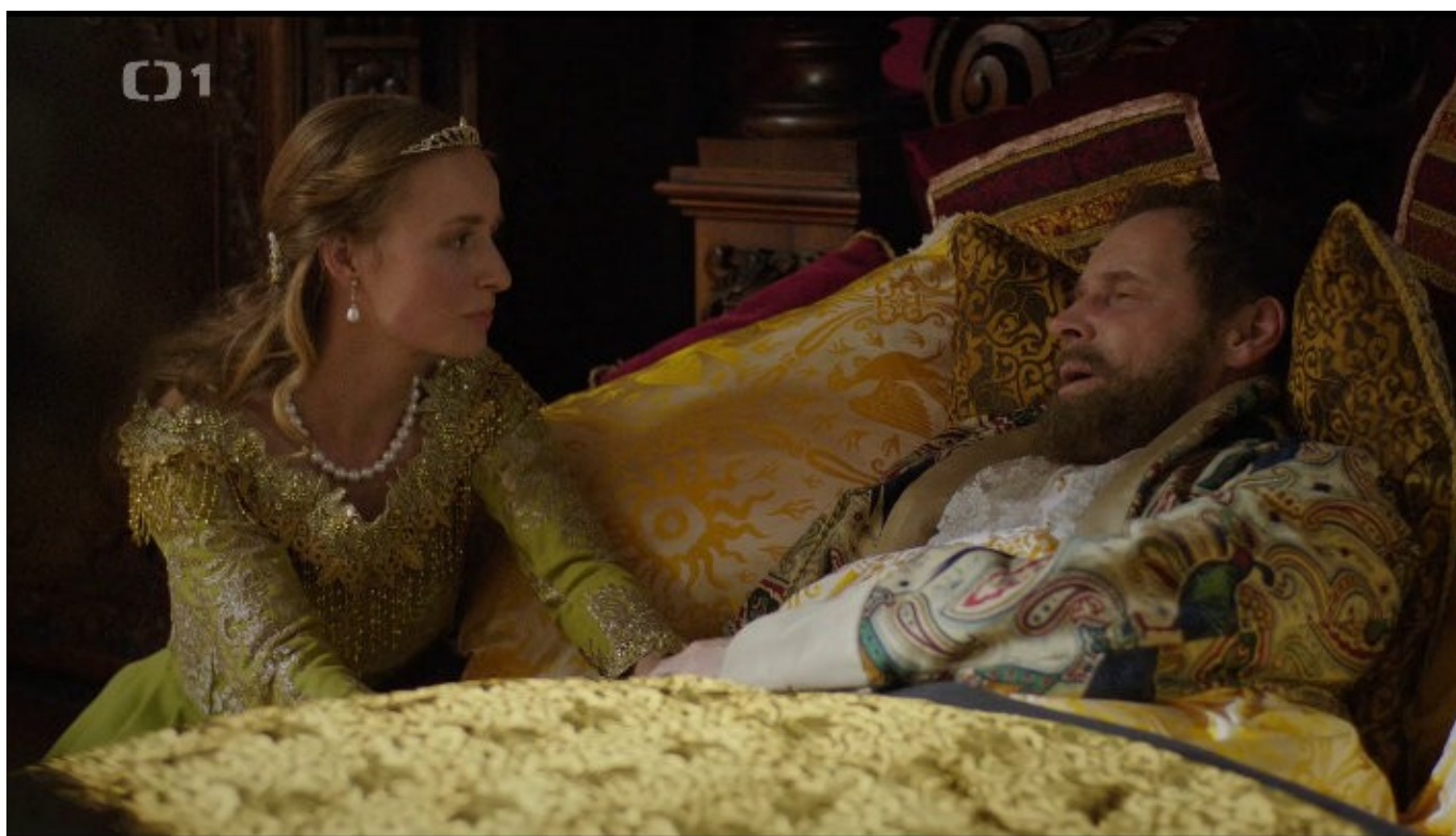
Princezna a král

Jak je psáno i jinde (a výstižně), děj je přímý a jednoduchý. Princezna se vydává najít korunu zakletého krále, aby pomohla svému otci (od smrtelné rýmičky a kašle, to my muži tak máme), a ve stopách za ní se vydává slepý kovář. Je až neskutečné, jak to může fungovat, navzdory infantilnímu skřítkovi (à la Řachanda), namixované perníkové bábě, jediné myšlence o poctivě nabroušeném ostří (Elfové ani Měsíčník by to nedokázali lépe), a kletbě připomínající Souboj Titánů. Samozřejmě, vlídnému přijetí nahrává prostředí, nefalšovaný sníh (a mrazy, kvůli kterým si herci údajně pořádně vytrpěli) a také uvěřitelnost postav, které si doslova „na nic nehrají“. Úplně nesouhlasím s tím, že jaksi nefungovala chemie mezi kovářem a princeznou. Na druhou stranu je pravda, že si jich pohromadě moc neužijeme a princezny samotné ještě méně. Ale bylo to dobré a bylo to fajn (a to koprodukční pohádky moc nemusím). Poctivých 6-7/10.