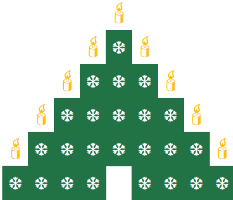
Vánoční strom ProExcel.cz